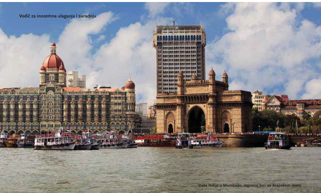
Vrata Indije u Mumbaiju, najvećoj luci na Arapskom moru

Za većinu stranih ulaganja na snazi je tzv. „automatsko odobrenje“, što podrazumijeva neuvjetovanje stranog ulaganja odobrenjem Vlade ili središnje banke.